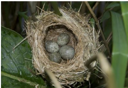
被普通布谷鸟寄生的苇莺巢。那个较大的蛋是寄生蛋。